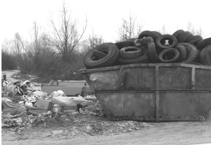
Po vyčistení príjazdovej komunikácie SMUTNÁ II