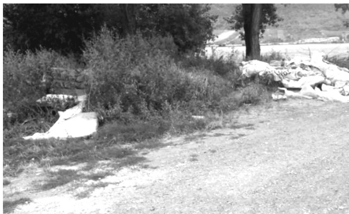
nelegálne skládky odpadu