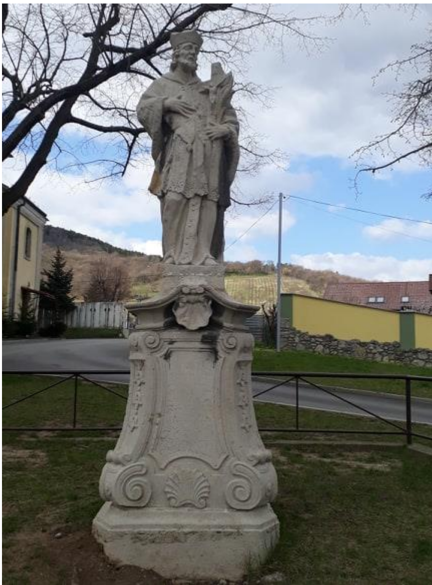
Socha sv. Jána Nepomuka