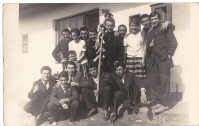
Veľkonočná šibačka 60-te roky