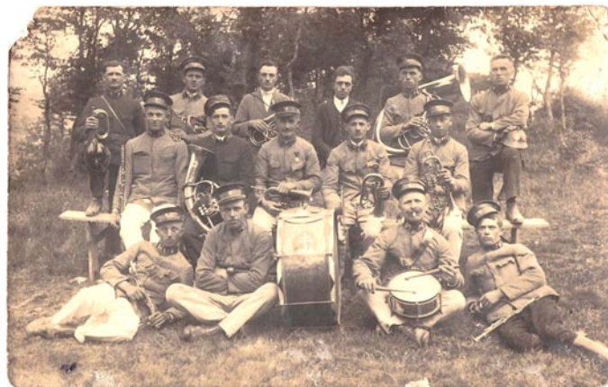
Dychová hudba, 20-te roky