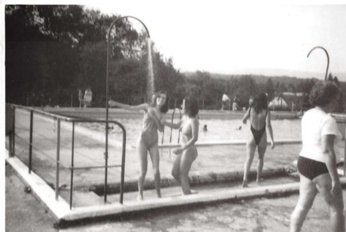
Kúpalisko Chemika, Majdánske