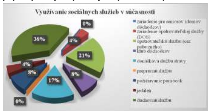
Graf č. 2 Využívanie sociálnych služieb v súčasnosti

Ďalšou otázkou sme chceli zistiť, na koho by sa respondenti obrátili v prípade trvalého zdravotného postihnutia. Zistili sme, že 38% respondentov by prijalo služby poskytované v domácom prostredí, s využitím opatrovateľskej služby, osobného asistenta; 24 % opýtaných by sa snažilo zaistiť si starostlivosť sám, pomocou blízkych; 17 % by prijalo pomoc inštitúcií s trvalou starostlivosťou, ako je domov dôchodcov, domov sociálnych služieb, domov opatrovateľskej služby. Z uvedeného vyplýva, že seniori sú viazaní na prostredie v ktorom žijú, ak by bolo nutné poskytnutie odbornej zdravotnej pomoci, chceli by ju prijať vo svojom dome, vo svojej izbe, vo svojej posteli. Taktiež majú ešte stále istotu, že v rodine sú dobré vzťahy, že deti dobre vychovali a v prípade potreby sa spoliehajú na pomoc rodiny.