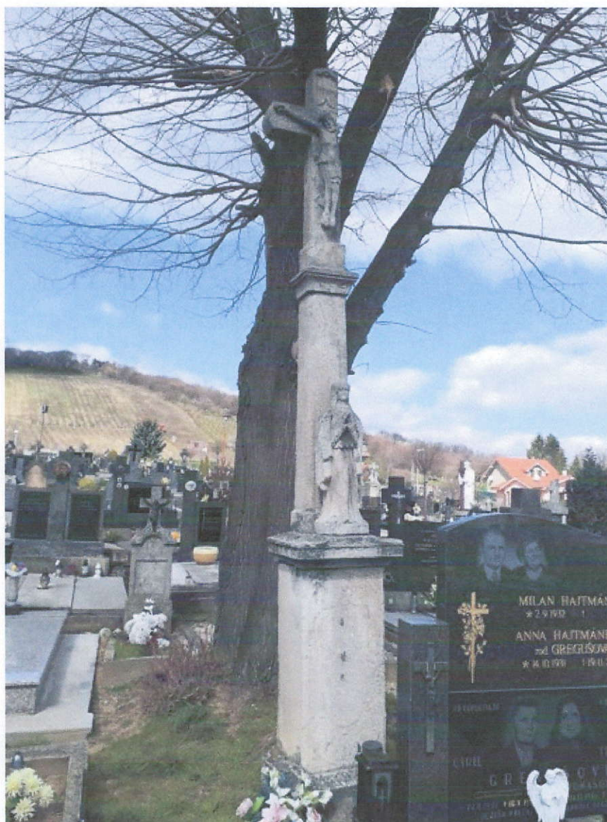
Hlavný kríž z 19. storočia