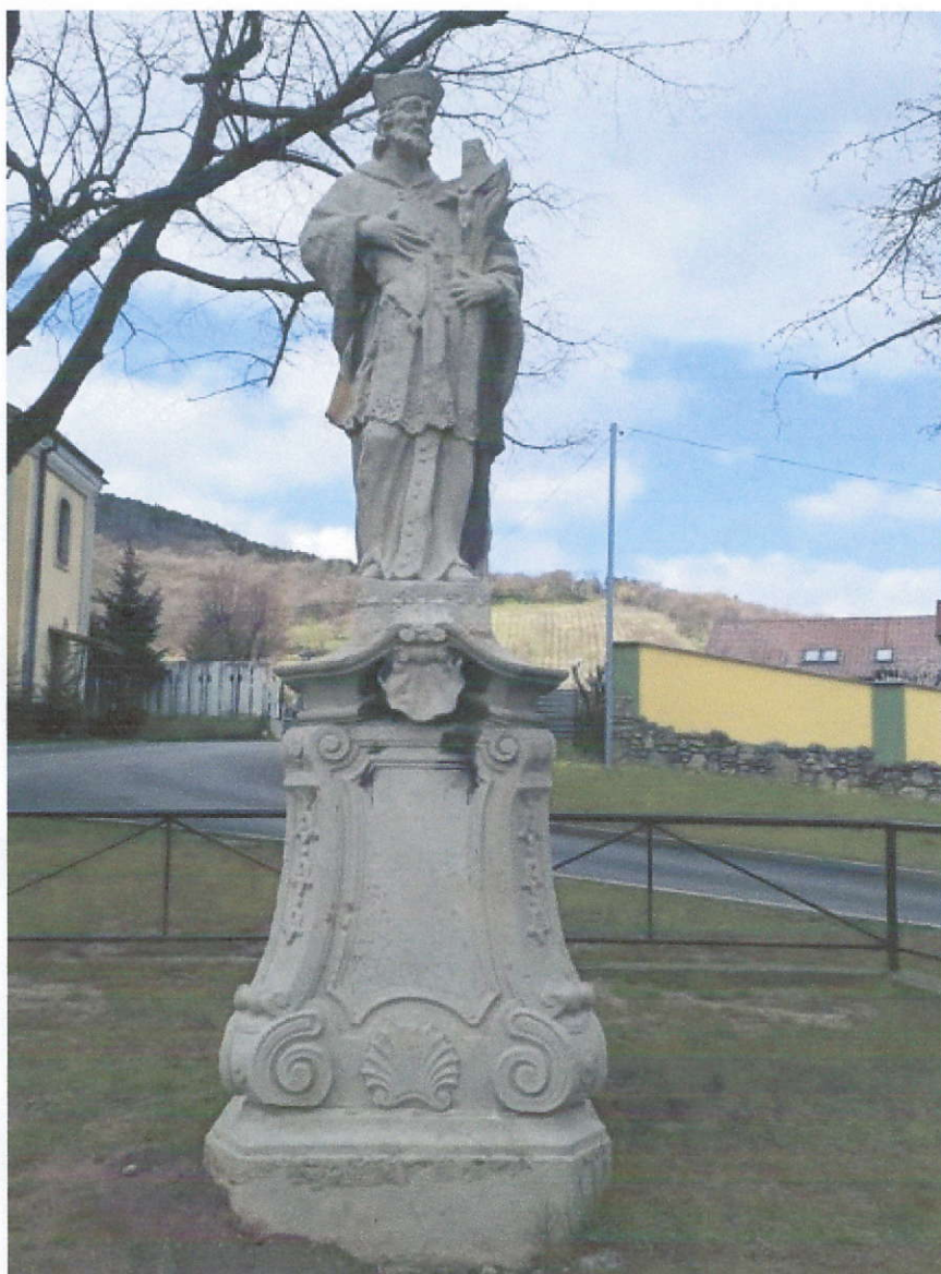
Socha sv. Jána Nepomuka